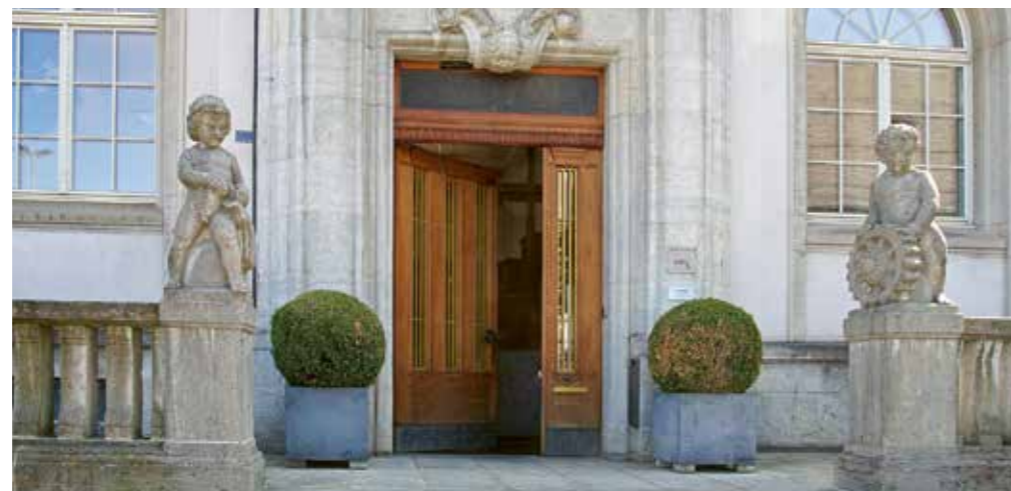
Die Türe der Standortförderung steht Ihnen jederzeit offen.

Dass Appenzell Ausserrhoden ein unternehmerfreundlicher Standort ist, zeigt auch die Statistik des Handelsregisters: Seit über 20 Jahren steigt die Zahl der ansässigen Unternehmen Jahr für Jahr. Seit der Jahrtausendwende hat sich der Unternehmensbestand im Kanton mehr als verdoppelt.